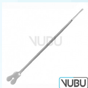
BRODIE SONDE 20,0CM