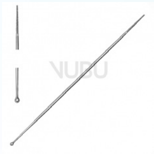
UCKERMANN WATTETRÄGER MIT OESE 15,0CM