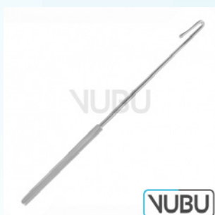
PRATT CYSTIKUS HAKEN FIG-2 KURZER HAKEN 21,0CM