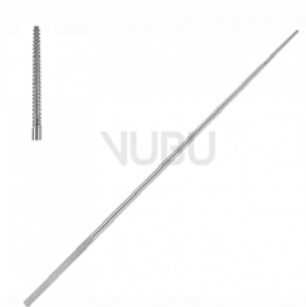
FARRELL WATTETRÄGER RUND 0,9MM 12,0CM