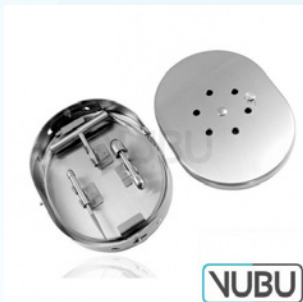
NABATOFF KRAMPFADER-BESTECK KOMPLETT