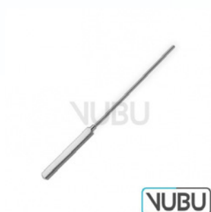
COOLEY GEFÄß DILATATOR BIEGSAM 2,0MM 13,0CM