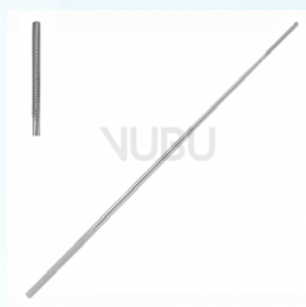
FARRELL WATTETRÄGER 3-KT 0,9MM 14,0CM