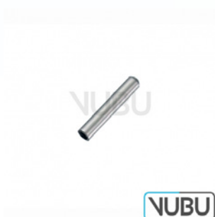
NABATOFF METALL-SONDENSPIITZE 3,0MM