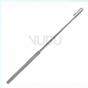
PRATT CYSTIKUS HAKEN FIG-1 ENGE BIEGUNG 21,0CM