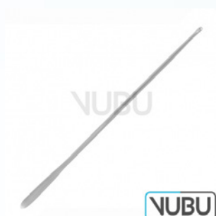
MYRTENBLATT SONDE 20,0CM