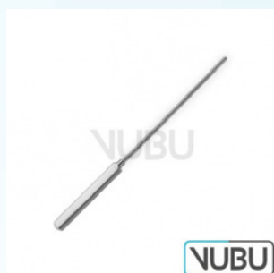
COOLEY GEFÄß DILATATOR BIEGSAM 0,5MM 13,0CM