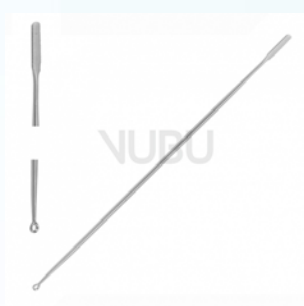
JOBSON-HORNE WATTETRÄGER 18,0CM Art.Nr.: VUBU-08-18118