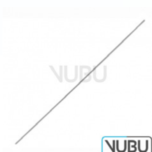
KNOPFSONDE FEIN Ø 1MM 11,5CM Art.Nr.: VUBU-08-2011