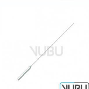
GARRETT GEFÄß DILATATOR BIEGSAM 1,5MM 14,0CM Art.Nr.: VUBU-08-20915