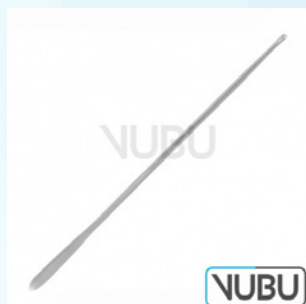
MYRTENBLATT SONDE 11,5CM