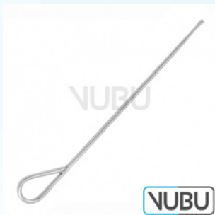
STACKE OHR SONDE Ø 1MM 10,5CM