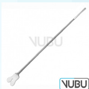
HOHL SONDE MIT KNOPF 14,5CM Art.Nr.: VUBU-08-3914