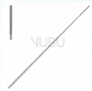
FARRELL WATTETRÄGER 3-KT 1,2MM 18,0CM