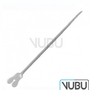
NELATON SONDE 16,0CM