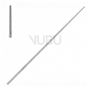
FARRELL WATTETRÄGER RUND 0,9MM 14,0CM