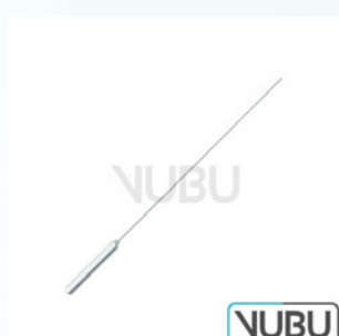
GARRETT GEFÄß DILATATOR BIEGSAM 1,0MM 14,0CM Art.Nr.: VUBU-08-20910