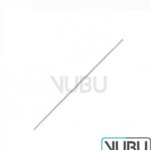
GARRETT GEFÄß DILATATOR BIEGSAM 1,0MM 21,0CM Art.Nr.: VUBU-08-21110