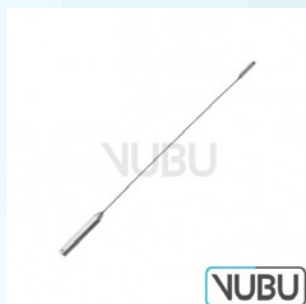
DE BAKEY GEFÄß DILATATOR BIEGSAM 9,0MM 19,0CM Art.Nr.: VUBU-08-21990