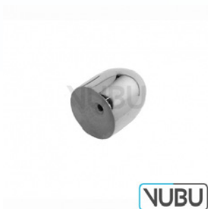
NABATOFF OLIVE ALLEIN 12,0MM