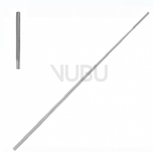
FARRELL WATTETRÄGER 3-KT 1,2MM 18,0CM