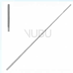
FARRELL WATTETRÄGER 3-KT 0,9MM 14,0CM