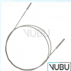
NABATOFF FLEXIBLES ROSTFREIES ZUGSEIL