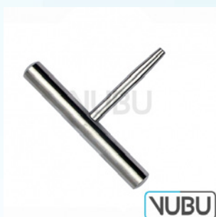
NABATOFF HANDGRIFF ALLEIN