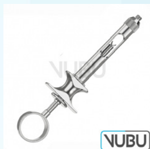
AMPULLENSPRITZE MIT ASPIRATION 1,8ML Art.Nr.: VUBU-10-88018