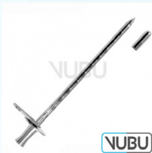
CAMPBELL TROKAR Ø 6MM 16,0CM Art.Nr.: VUBU-10-16706