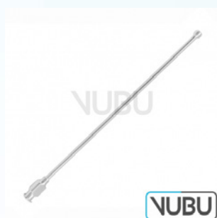
SCHMID KANÜLE Ø 6MM 15,0CM Art.Nr.: VUBU-10-75906