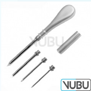
UNIVERSAL TROKARE SATZ ZU 4 STUECK FLACHGRIFF Art.Nr.: VUBU-10-12904