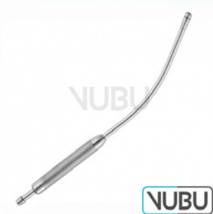
COOLEY SAUGROHR Ø 6MM 30,0CM Art.Nr.: VUBU-10-44303