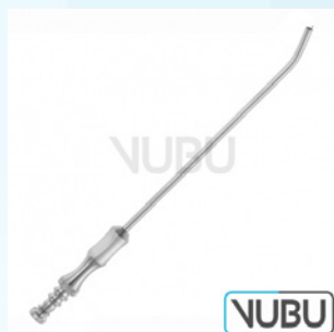
ADSON SAUGKANÜLE Ø 4MM 21,0CM Art.Nr.: VUBU-10-46904