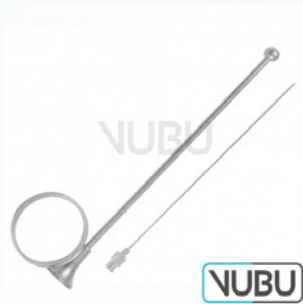
IOWA TROMPETE UND KANÜLE 14,0CM Art.Nr.: VUBU-10-76914