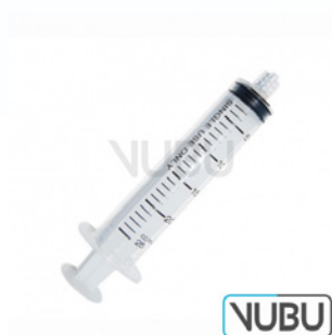
EINWEGSPRITZE 60STK 60ML Art.Nr.: VUBU-10-89406