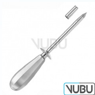
NELSON TROKAR FIG-3 Ø 11,0MM 21,0CM Art.Nr.: VUBU-10-15903