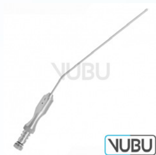
FRAZIER SAUGKANÜLE 10 CHARR Art.Nr.: VUBU-10-44910