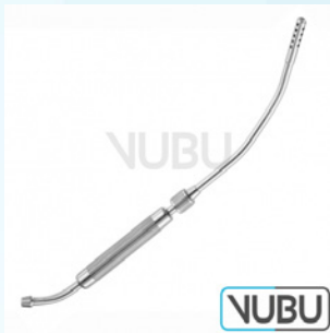
COOLEY SAUGROHR Ø 8MM 33,0CM Art.Nr.: VUBU-10-44301