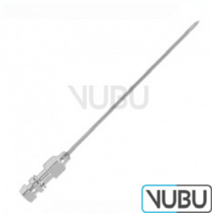
TUOHY NADEL Ø 1,2MM X 80MM Art.Nr.: VUBU-10-70916