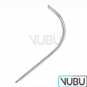
FÜHRUNGSNADEL 14 CHARR Art.Nr.: VUBU-10-84114