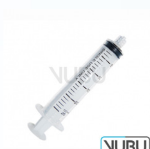
EINWEGSPRITZE 80STK 20ML Art.Nr.: VUBU-10-89402