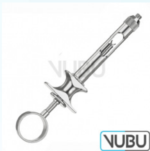
AMPULLENSPRITZE MIT ASPIRATION 1,8ML Art.Nr.: VUBU-10-88018