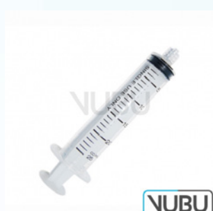
EINWEGSPRITZE 60STK 60ML Art.Nr.: VUBU-10-89406