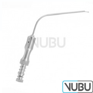
FERGUSON SAUGROHR 9 CHARR Art.Nr.: VUBU-10-45309