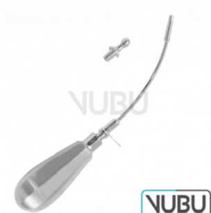
PIERCE OBERKIEFER TROKAR MIT OLIVE Ø 3,0MM Art.Nr.: VUBU-10-20930