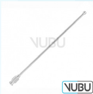
SCHMID KANÜLE Ø 6MM 15,0CM Art.Nr.: VUBU-10-75906