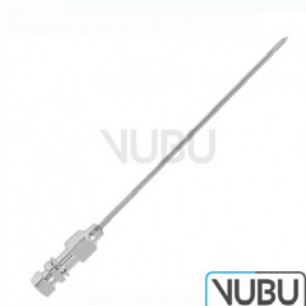
TUOHY NADEL Ø 1,2MM X 80MM Art.Nr.: VUBU-10-70916