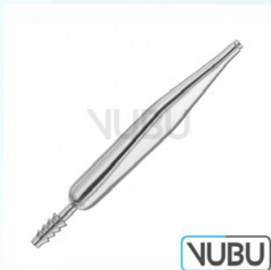
COUPLAND SAUGHANDGRIFF Art.Nr.: VUBU-10-48401