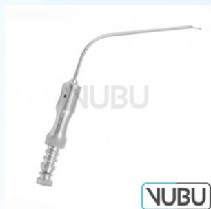
FERGUSON SAUGROHR 6 CHARR Art.Nr.: VUBU-10-45306