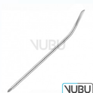
FÜHRUNGSNADEL 18 CHARR Art.Nr.: VUBU-10-84018