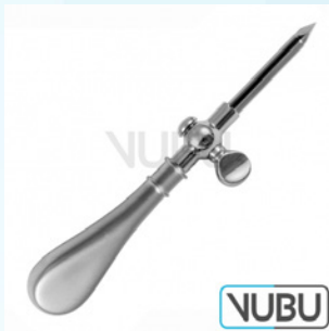
BUELAU TROKAR Ø 8MM 24,0CM Art.Nr.: VUBU-10-16300