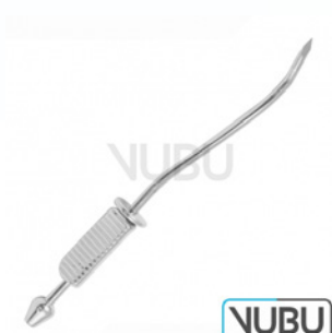
DOUGLAS TROKAR Ø 3MM 11,0CM Art.Nr.: VUBU-10-20400