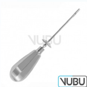
STANDARD TROKAR MIT SCHILD Ø 6,0MM 11,0CM Art.Nr.: VUBU-10-13960