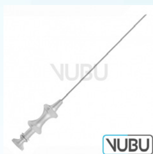
EICKEN TROKAR Ø 2,0MM X 105MM Art.Nr.: VUBU-10-19520