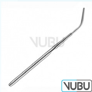
COGSWELL SAUGROHR Ø 2MM 24,5CM Art.Nr.: VUBU-10-47920