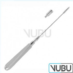
LICHTWITZ TROKAR GERADE Ø 1,8MM Art.Nr.: VUBU-10-19900