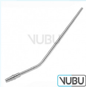
LUER SAUGROHR Ø 4,5MM 11,0CM Art.Nr.: VUBU-10-48045