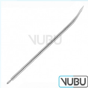
FÜHRUNGSNADEL 14 CHARR Art.Nr.: VUBU-10-83914