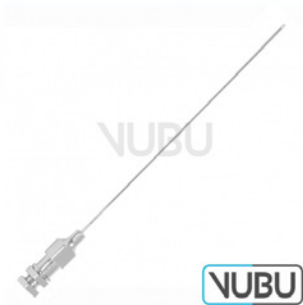
QUINKE BIOPSIE KANÜLE Ø 0,7MM X 76MM Art.Nr.: VUBU-10-73901