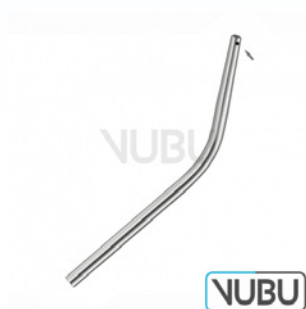
COUPLAND SAUGKANÜLE Ø 3,5MM MIT SEITENLOCH Art.Nr.: VUBU-10-46704