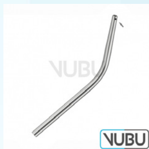
COUPLAND SAUGKANÜLE Ø 3,5MM MIT SEITENLOCH Art.Nr.: VUBU-10-46704