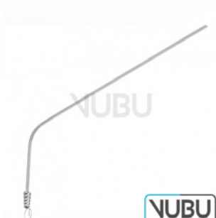
SAUGROHR Ø 2,5MM 13,0CM Art.Nr.: VUBU-10-46113