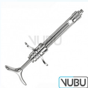
AMPULLENSPRITZE OHNE ASPIRATION 1,8ML Art.Nr.: VUBU-10-88118