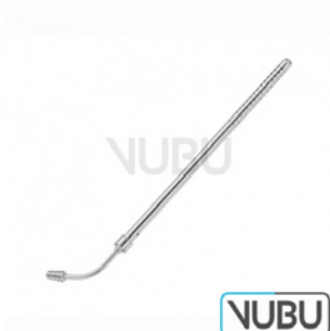
BABY-POOLE SAUGROHR Ø 5,5MM Art.Nr.: VUBU-10-44120