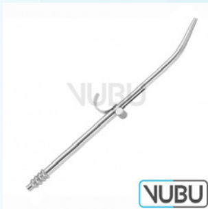
BYRD SAUGROHR Ø 3,5MM 15,0CM Art.Nr.: VUBU-10-43135