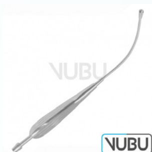
ANDREW-PINCHON SAUGROHR Art.Nr.: VUBU-10-42500