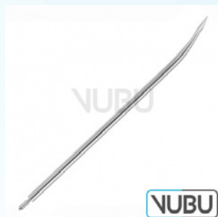
FÜHRUNGSNADEL 14 CHARR Art.Nr.: VUBU-10-83914