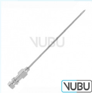
LANDAU TROKAR Ø 2,0MM Art.Nr.: VUBU-10-18916