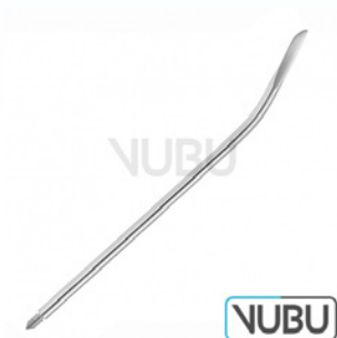
FÜHRUNGSNADEL 16 CHARR Art.Nr.: VUBU-10-84016