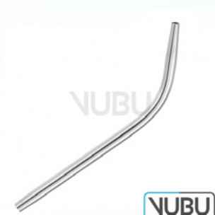
DENTALSAUGROHR Ø 4,0MM 18,0CM Art.Nr.: VUBU-10-48304