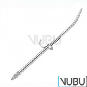
BYRD SAUGROHR Ø 3,5MM 15,0CM Art.Nr.: VUBU-10-43135