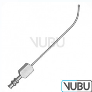
EICKEN-KILLIAN SAUGKANÜLE Ø 2,5MM Art.Nr.: VUBU-10-45503