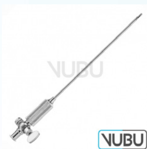
VERRES KANÜLE Ø 2,0MM X 120MM Art.Nr.: VUBU-10-79912