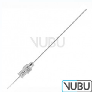
MENGHINI BIOPSIE KANÜLE Ø 1,6MM X 70MM Art.Nr.: VUBU-10-73407