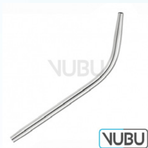
DENTALSaugrohr Ø 4,0MM 18,0CM Art.Nr.: VUBU-10-48304