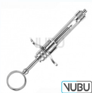
ZYLINDER AMPULLENSPRITZE 1,8ML Art.Nr.: VUBU-10-88418