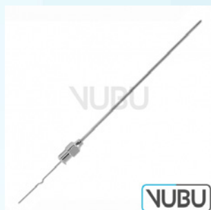
MENGHINI BIOPSIE KANÜLE Ø 1,8MM X 168MM Art.Nr.: VUBU-10-73618