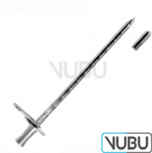
CAMPBELL TROKAR Ø 6MM 16,0CM Art.Nr.: VUBU-10-16706