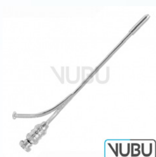
OCHSNER TROKAR 20 CHARR Art.Nr.: VUBU-10-17920