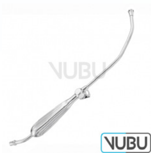
WALTON-YANKAUER SAUGROHR Art.Nr.: VUBU-10-42300