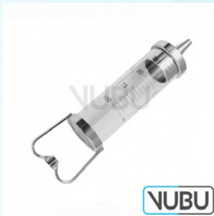
JANET ZYLINDER 200ML Art.Nr.: VUBU-10-89020