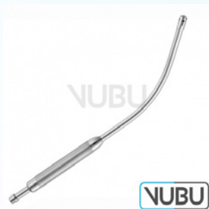
COOLEY SAUGROHR Ø 10MM 30,0CM Art.Nr.: VUBU-10-44304