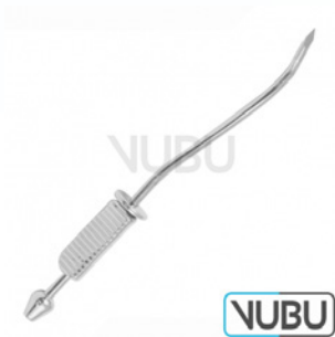
DOUGLAS TROKAR Ø 3MM 11,0CM Art.Nr.: VUBU-10-20400