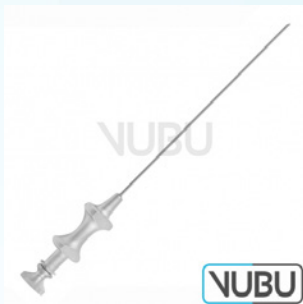
EICKEN TROKAR Ø 2,0MM X 105MM Art.Nr.: VUBU-10-19520