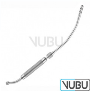
COOLEY SAUGROHR Ø 8MM 33,0CM Art.Nr.: VUBU-10-44301