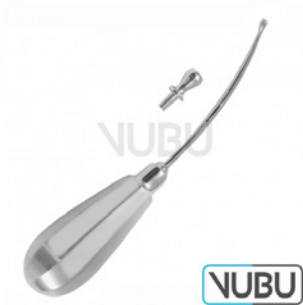
KRAUSE TROKAR Ø 5,5MM 15,0CM Art.Nr.: VUBU-10-21355