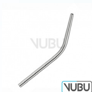
COUPLAND SAUGKANÜLE Ø 3,5MM Art.Nr.: VUBU-10-46604