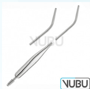
COUPLAND SAUGROHR 27,0CM Art.Nr.: VUBU-10-42900