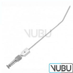
PLESTER SAUGROHR Ø 1,5MM Art.Nr.: VUBU-10-45115