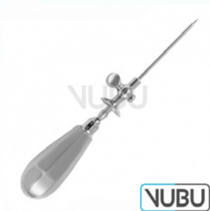
STANDARD TROKAR MIT SCHILD UND HAHN Ø 5,0MM 12,0CM Art.Nr.: VUBU-10-14150