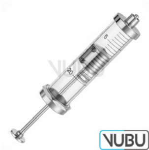
VAKUUM GLASZYLINDERSPRITZE 50 ML Art.Nr.: VUBU-10-88805