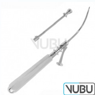
COAKLEY KIEFERHOEHLLEN TROKAR SATZ Ø 2,25MM Art.Nr.: VUBU-10-21916