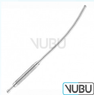
COOLEY SAUGROHR Ø 8MM 35,0CM Art.Nr.: VUBU-10-44302