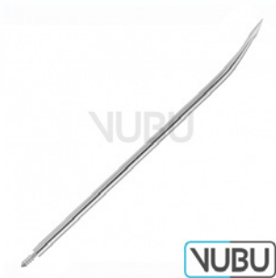
FÜHRUNGSNADEL 8 CHARR Art.Nr.: VUBU-10-83908