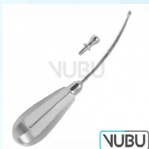
KRAUSE TROKAR Ø 5MM 15,0CM Art.Nr.: VUBU-10-21350