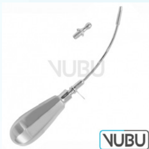
PIERCE OBERKIEFER TROKAR MIT OLIVE Ø 5,0MM Art.Nr.: VUBU-10-20950