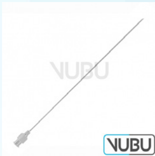
EINZEL KANÜLE FÜR IOWA TROMPETE VUBU-10-76914 14CM 1MM Art.Nr.: VUBU-10-76914_kan