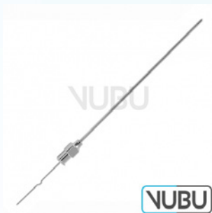
MENGHINI BIOPSIE KANÜLE Ø 1,8MM X 168MM Art.Nr.: VUBU-10-73618