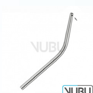
COUPLAND SAUGKANÜLE Ø 2,5MM MIT SEITENLOCH Art.Nr.: VUBU-10-46703