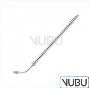
BABY-POOLE SAUGROHR Ø 5,5MM Art.Nr.: VUBU-10-44120