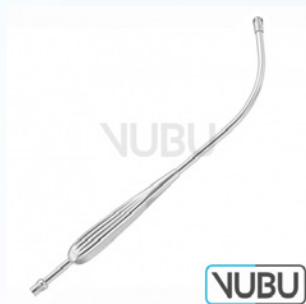
DE BAKEY SAUGROHR Art.Nr.: VUBU-10-42700