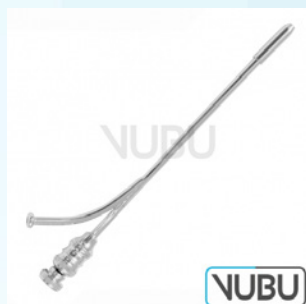
OCHSNER TROKAR 20 CHARR Art.Nr.: VUBU-10-17920