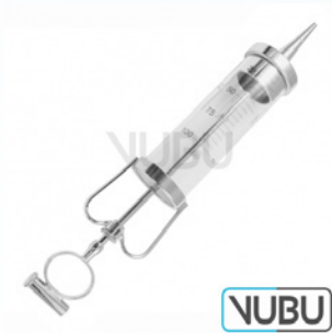
JANET SPRITZE 100ML Art.Nr.: VUBU-10-88910