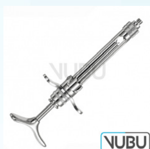
AMPULLENSPRITZE OHNE ASPIRATION 1,8ML Art.Nr.: VUBU-10-88118