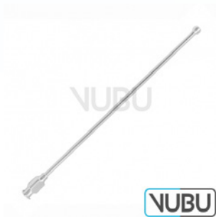
SCHMID KANÜLE Ø 3MM 15,0CM Art.Nr.: VUBU-10-75903