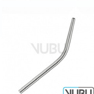
COUPLAND SAUGKANÜLE Ø 3,5MM Art.Nr.: VUBU-10-46604