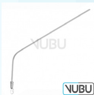
SAUGROHR Ø 2,0MM 13,0CM Art.Nr.: VUBU-10-46013