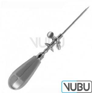
STANDARD TROKAR MIT SCHILD HAHN UND ABFLUSSROHR Ø 6,0MM 12,0CM Art.Nr.: VUBU-10-14360