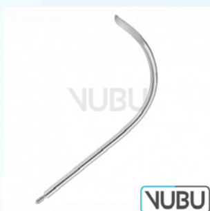
FÜHRUNGSNADEL 10 CHARR Art.Nr.: VUBU-10-84110