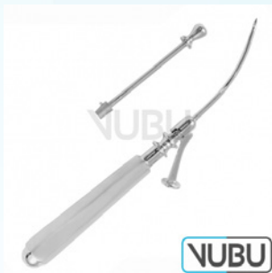
COAKLEY KIEFERHOEHLLEN TROKAR SATZ Ø 2,25MM Art.Nr.: VUBU-10-21916