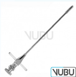
LICHTWITZ TROKAR Ø 1,6MM 11,0CM Art.Nr.: VUBU-10-20100