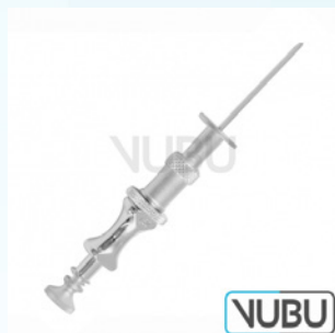
KLIMA-ROSSEGGER KANÜLE Ø 1,8MM X 35MM Art.Nr.: VUBU-10-67918