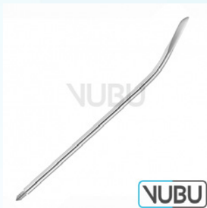
FÜHRUNGSNADEL 14 CHARR Art.Nr.: VUBU-10-84014