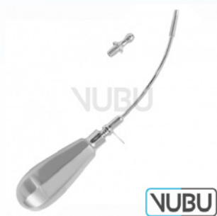
PIERCE OBERKIEFER TROKAR MIT OLIVE Ø 5,0MM Art.Nr.: VUBU-10-20950