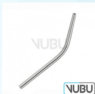
COUPLAND SAUGKANÜLE Ø 2,0MM Art.Nr.: VUBU-10-46602