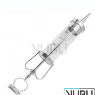
JANET SPRITZE 100ML Art.Nr.: VUBU-10-88910