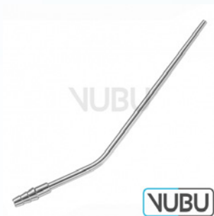
LUER SAUGROHR Ø 3,5MM 11,0CM Art.Nr.: VUBU-10-48035