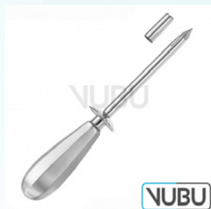
NELSON TROKAR FIG-3 Ø 11,0MM 21,0CM Art.Nr.: VUBU-10-15903