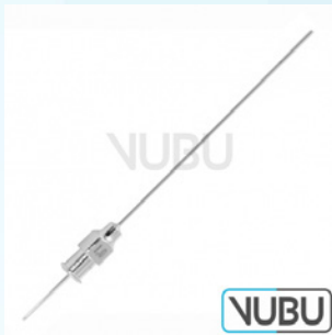
MENGHINI BIOPSIE KANÜLE Ø 1,6MM X 70MM Art.Nr.: VUBU-10-73407