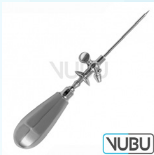
STANDARD TROKAR MIT SCHILD HAHN UND ABFLUSSROHR Ø 6,0MM 12,0CM Art.Nr.: VUBU-10-14360