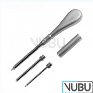
UNIVERSAL TROKARE SATZ ZU 3 STUECK FLACHGRIFF Art.Nr.: VUBU-10-12903